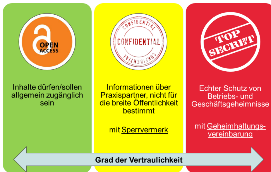
Abbildung 1: Einstufung der Abschlussarbeit anhand der Vertraulichkeit

Beim Schutz von Betriebs- und Geschäftsgeheimnissen im Rahmen von Abschlussarbeiten gibt es verschiedene Ansätze. Regelmäßig wird in diesem Zusammenhang der Begriff „Sperrvermerk“ verwendet. Dieser ist allerdings nicht eindeutig definiert und wird häufig bereits dann verwendet, wenn eigentlich nur die Veröffentlichung der Arbeit eingeschränkt werden soll. Die Hochschule Emden/Leer orientiert sich daher am Grad der Vertraulichkeit. Hierbei kann wie folgt unterschieden werden: